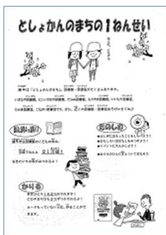
〔市立図書館の活用の推進〕