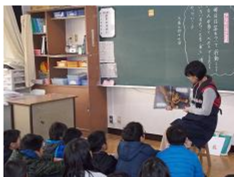
〔図書ボランティアとの連携〕

学校と学校図書ボランティアとの連携や、ボランティア活動の発展・向上を目的とする「学校図書ボランティアネットワーク『心のたね』」の活動を支援します。また、各学校の学校図書ボランティアが活動しやすいような環境整備に努めるとともに、研修会や講座に関する情報提供を行います。