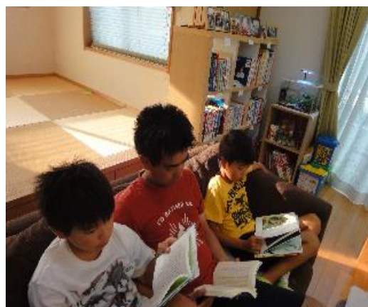
〔「親子読書活動10分間運動（家読）」の推進〕