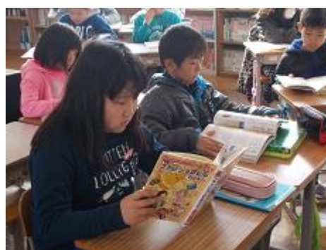
〔「読書の時間」の設定〕