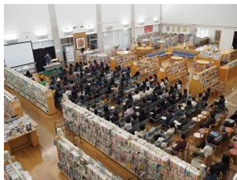
〔子どもの本に関する講演会〕