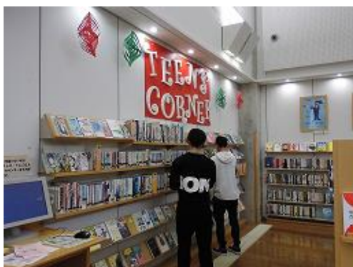
〔青少年コーナーの充実〕