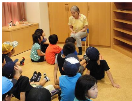
〔ボランティアとの連携〕