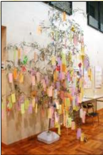
<図書館入口から右手側へ>