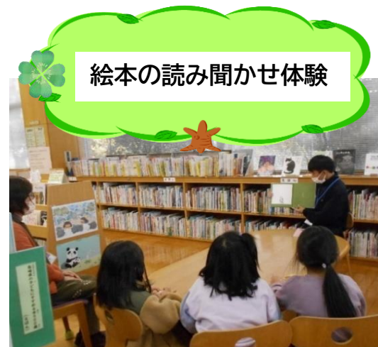
絵本の読み聞かせ体験