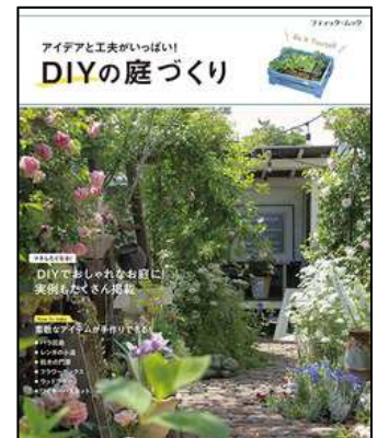
『DIYの庭づくり』 東宮千鶴／編 (ブティック社)