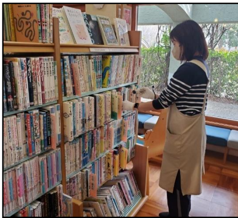
ほんのバーコード読み込み中

1年に1回、図書館にある本がすべてあるか、本の点検をします。たらみ図書館では、2月に行いました。かだし中の本をのぞく本を、1冊1冊機械を使って読み込みました。