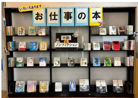
【一般】『いろいろあります お仕事の本』