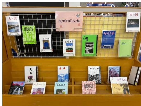
【地域】『九州の同人誌』