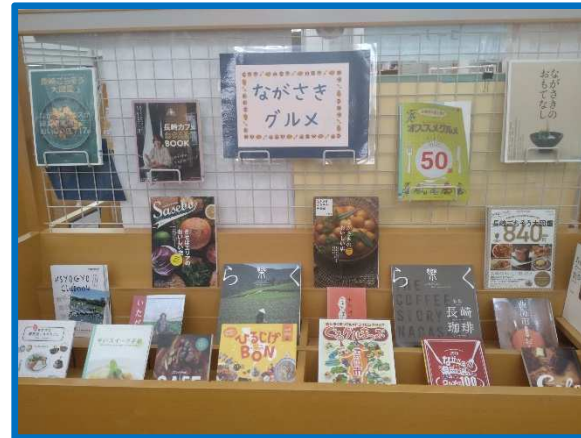
【地域】 ながさきグルメ