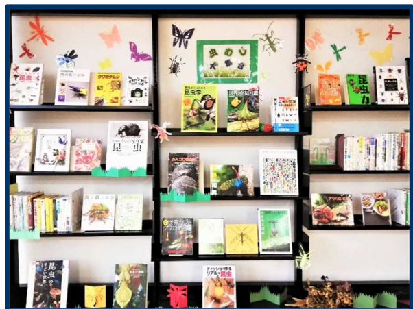
【一般書】 虫・むし大集合