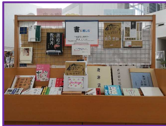
【地域】書に親しむ ~尾花忌によせて~