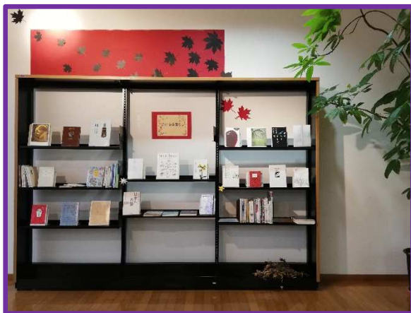
【一般書】詩のある暮らし