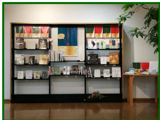
ブックデザイン展