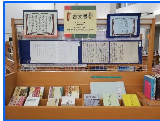
古文書第一弾「御記録書抜」