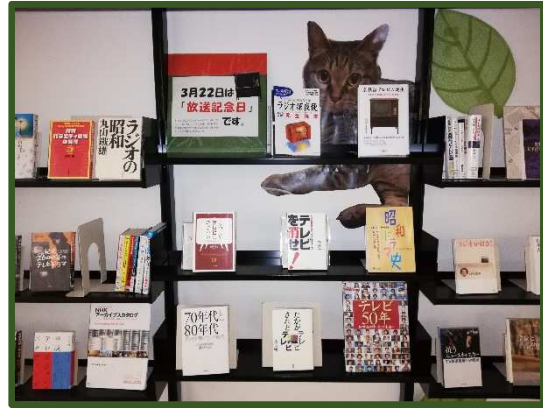
3月22日は放送記念日