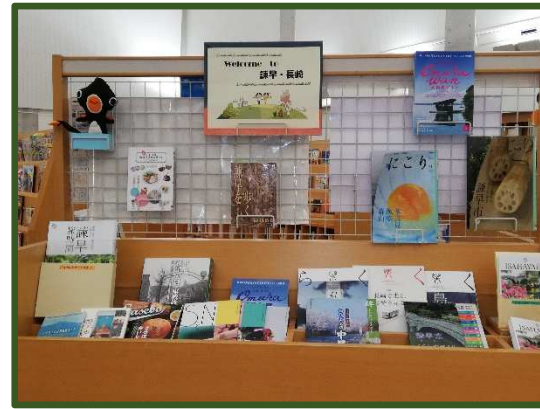
Welcome to 諫早・長崎