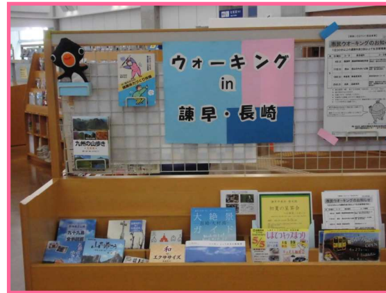
ウォーキング in 諫早・長崎